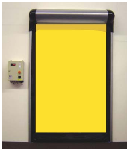
D3 I 3LF - interiér

Elegantnější provedení fóliových vrat do interiéru o maximálních rozměrech 3500 x 3500 mm. Motor je integrovaný na hřídele navěšovacího boxu. Vrata se vyznačují také velmi malou hlučností. Stejně jako u typu D3 I 1LF je možno požadovat provedení CLEANROOM pro prostory se zvýšenými požadavky na hygienu. Konstrukce vrat z nerezové či pozinkované oceli.