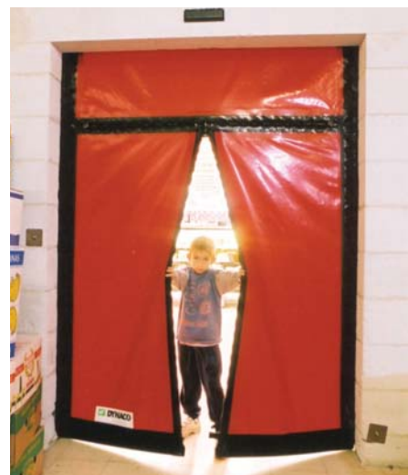
M2v1 únikový východ - interiér

Rychloběžná vrata pro použití do interiéru o maximálních rozměrech 5500 x 5500 mm. Díky zipovému systému slouží také jako únikový východ. Do původní podoby vrata dostaneme jednoduchým spojením během několika málo vteřin. Konstrukce vrat je z lakované oceli.