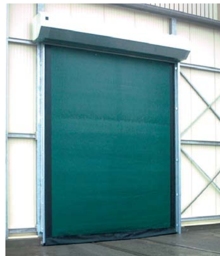
M2 - interiér i exteriér

Univerzální rychloběžná vrata nabízená v maximálním rozměru 5500 x 5500 mm ve třech provedení. S odolností vůči větru do 60km/h. COMPACT, do 100km/h. POWER, do 160km/h. ALL WEATHER. Pohyb vrat díky dokonalému PUSH-PULL systému. Konstrukce vrat je z nerezové či pozinkované oceli.