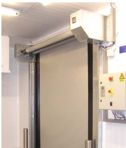
M2 freezer -30°C - interiér

Rychloběžná vrata pro použití do interiéru, speciálně pak pro chladírenské a potravinářské provozy. Maximální velikost vrat je 4500 x 4500 mm. Použití vrat pro provozy s nízkou teplotou je docíleno speciální vodící lištou, která přerušuje tepelný most mezi zdí budovy a konstrukcí vrat. Topné kabely umístěné ve vodících lištách pak zabraňují namrznání této konstrukce.