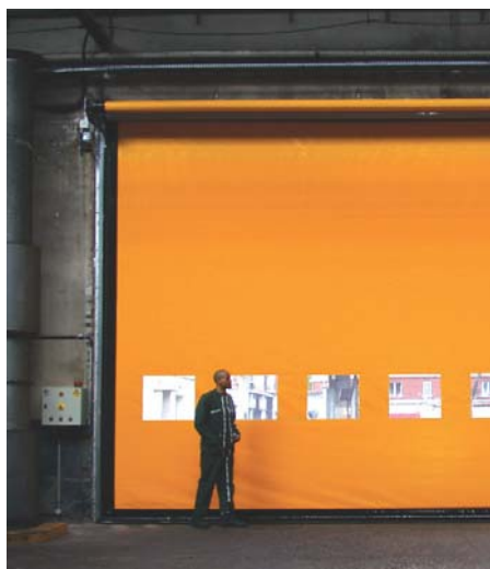
M3 - interiér i exteriér

Univerzální rychloběžná vrata určená pro velké rozměry, až 11000 x 5500 mm ve třech provedení. S odolností vůči větru do 60km/h. COMPACT, do 100km/h. POWER, do 160km/h. ALL WEATHER. Pohyb vrat díky dokonalému PUSH-PULL systému. Konstrukce vrat je z nerezové či pozinkované oceli.