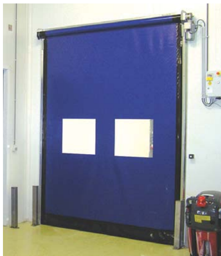
D3 I 1LF - interiér

Modelová řada pro interiérové použití s maximálními rozměry 4000 x 4000 mm. Tento typ vrat je nabízen kromě základní varianty také v provedení CLEANROOM pro provozy s vysokými nároky na hygienu a časté čištění. To je umožněno speciálním krytem motoru, hřídele a optimalizovaným utěsněním. Konstrukce vrat je z nerezové nebo pozinkované oceli.